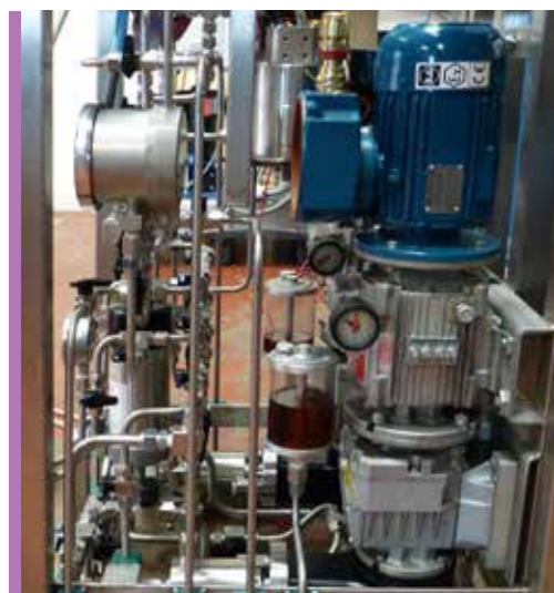
Variateur K2 sur pompe secteur chimique