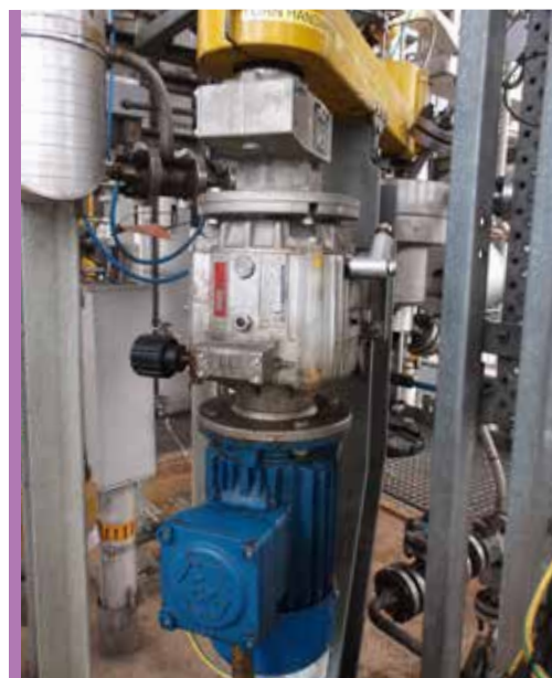
Variateur K4 sur mélangeur secteur pétrolière