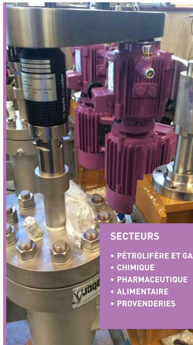
Variateur K2 sur mélangeur pour hydrocarbures