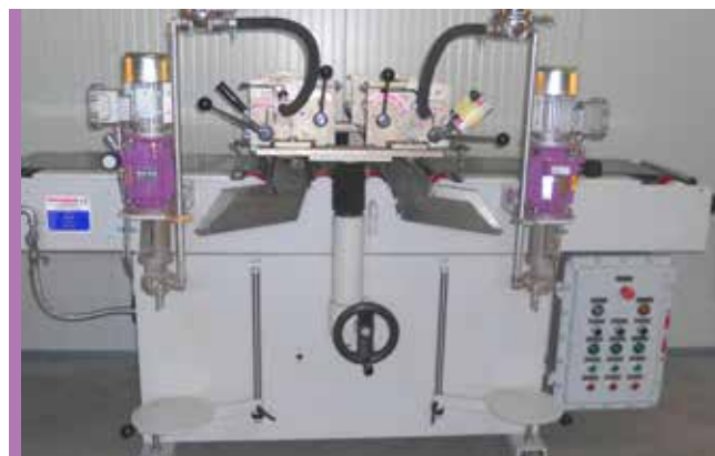
Machine à peindre: variateur K2 sur pompe doseuse