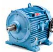
16 (5,5-7,5 kW) 16B (11 kW)