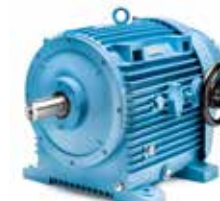
17 (15 kW) 17B (22 kW)