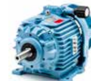
K5 (2,2-3-4 kW)