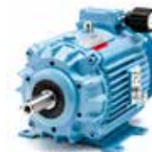
K4 (1,1-1,5 kW)