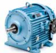
15 (3-4 kW)