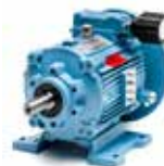
K2 (0,37-0,55-0,75 kW)